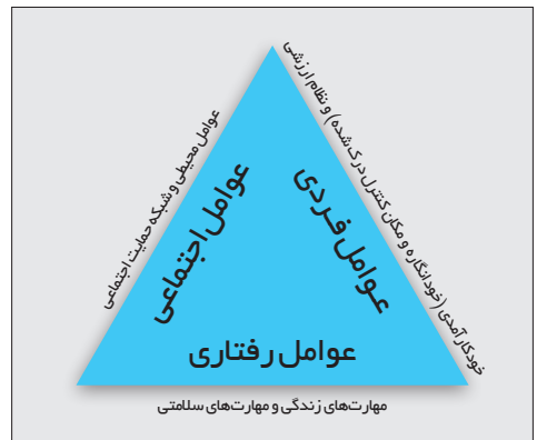
شکل ۲- ارتباط خودمراقبتی، توانمندی، خودکارآمدی